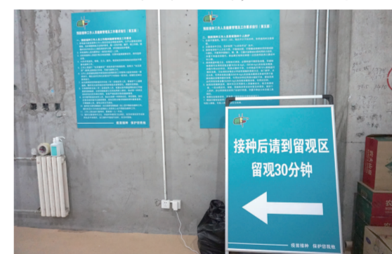
合生汇接种点随处可见指示牌