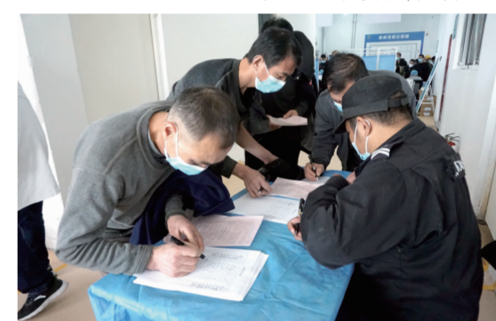
合生汇开放夜场接种,居民进行信息登记。