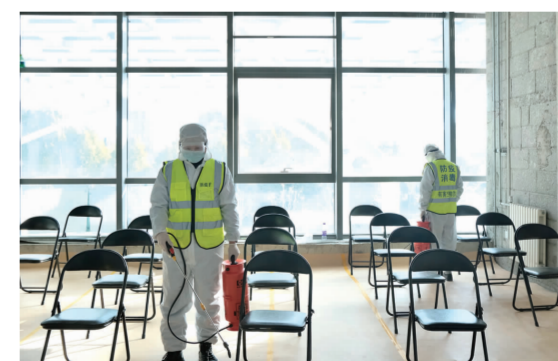
接种点留观区定时进行消杀