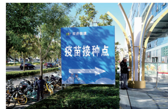
合生汇疫苗接种点指示牌