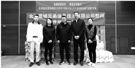
党建协调委员会成员单位为地区一线工作人员送慰问