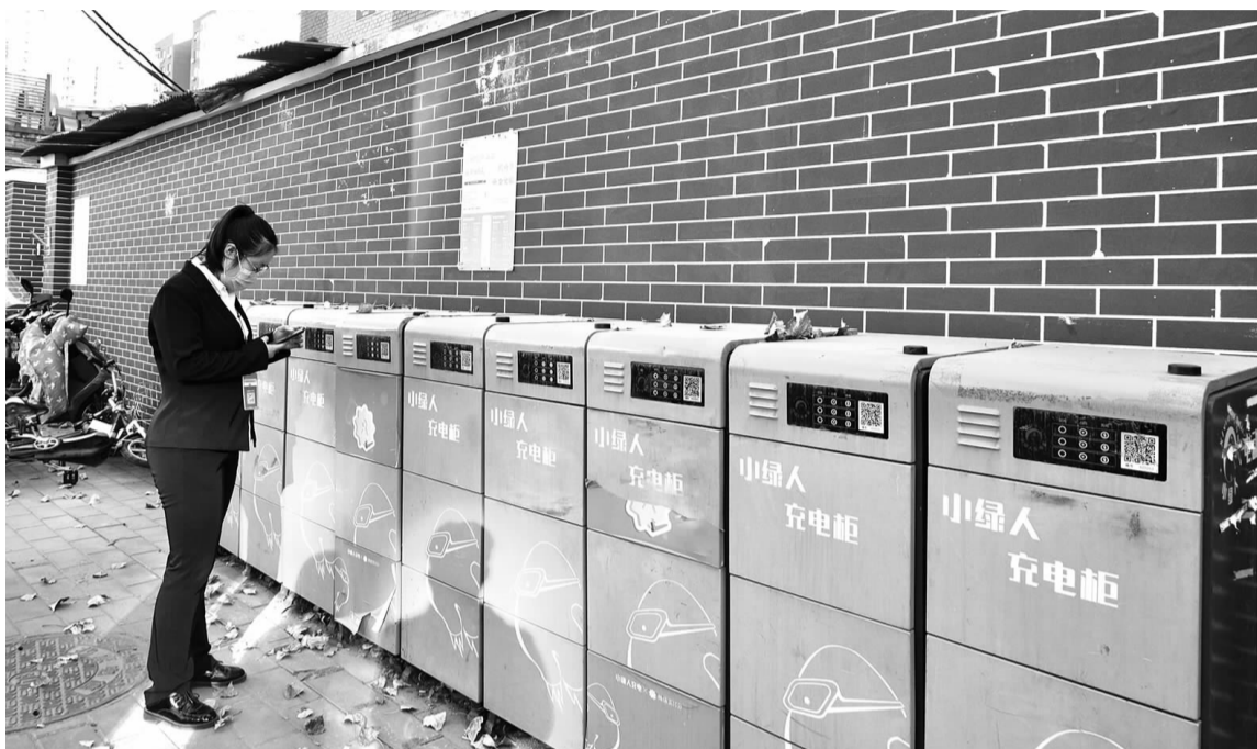
居民正在扫码使用小绿人充电桩