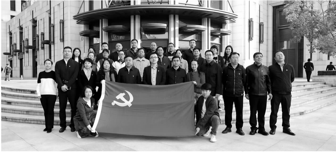
双井街道理论中心组一行在中关村国际创投集聚区合影