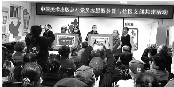
人美出版社为广外南社区党员赠送画册