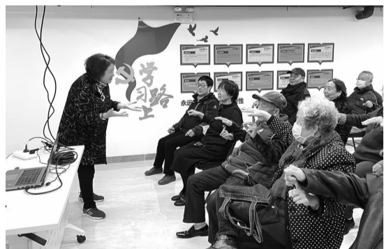
宣讲老师带领居民做抓手游戏

“从前有座山，山上有座庙……”正式开讲前，老师先组织居民共同进行一个抓手游戏。请大家把右手成掌放在自己身体的右前方，左手指尖顶住左边居民的掌心。当大家听到特定字时，右手要去抓住掌心下面的手指，左手要尽力逃脱他人的掌心，看谁最终被抓住。游戏引得居民们笑声连连，居民的注意力也由此集中。讲座正式开始，老师