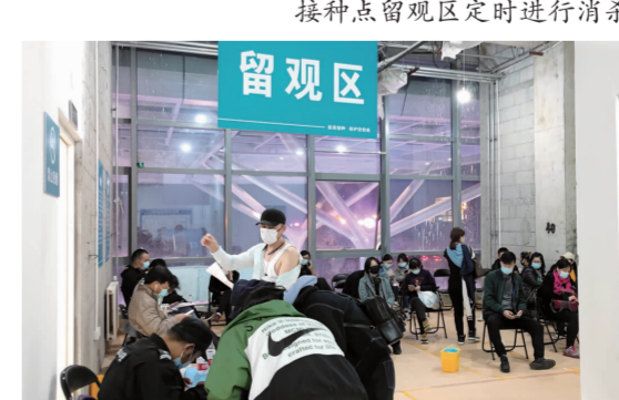
夜场居民在留观区等候