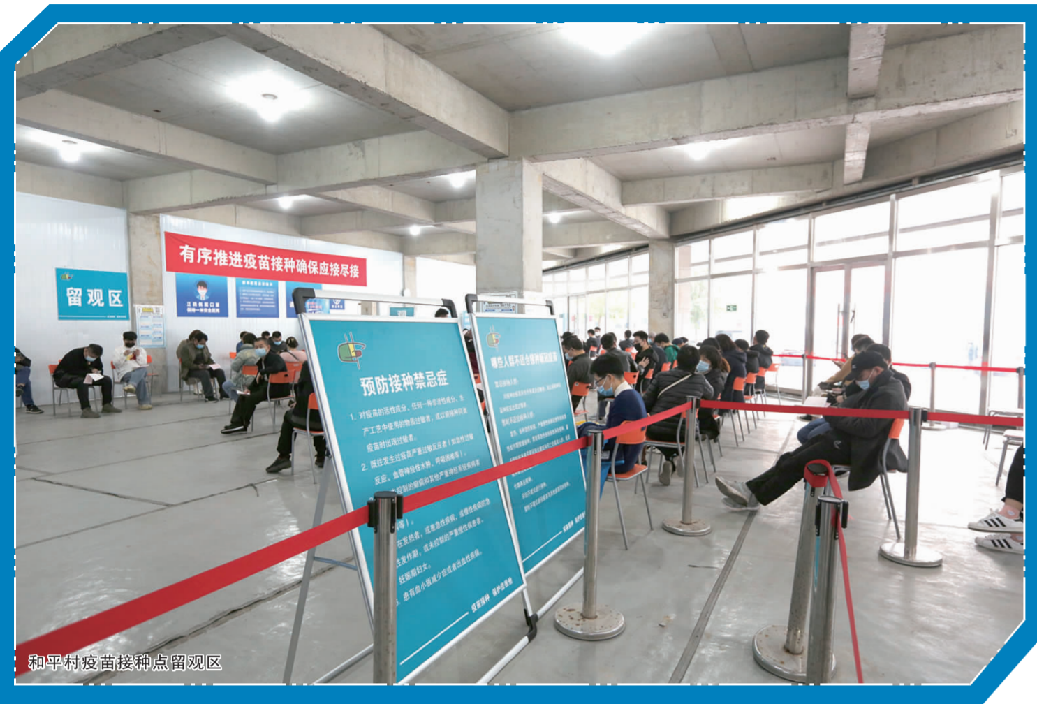
和平村疫苗接种点留观区

所有人入境进京人员、有风险地区旅居史人员以及与涉疫人员、地区、场所所有交集人员要按要求及时排查管控报告,个人要严格落实各项常态化防控要求,有涉疫地区旅居史、人员接触史的要第一时间主动报告,按照要求进行核酸检测、健康管理。