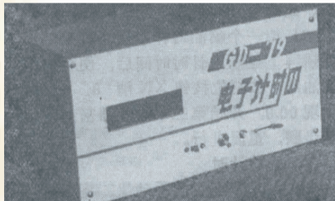
GD-79 电子计时器的外形图